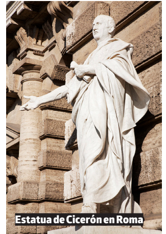
Estatua de Cicerón en Roma

En la época romana, las mujeres se adornaban con joyas, diademas y peinados complicados.