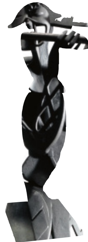
Pablo Gargallo. Pequeño Arlequín con flauta (1931). Chapa de cobre. 34 x 12 cm. Colección particular, Barcelona.