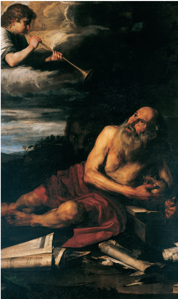
San Jerónimo y el Ángel del Juicio. Ribera (Colegiata de Osuna, Jaén)