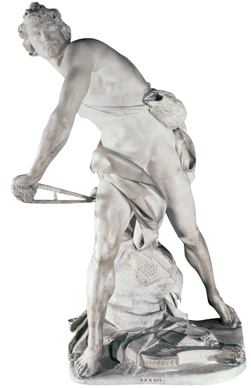
David. Bernini (Galería Borghese, Roma)