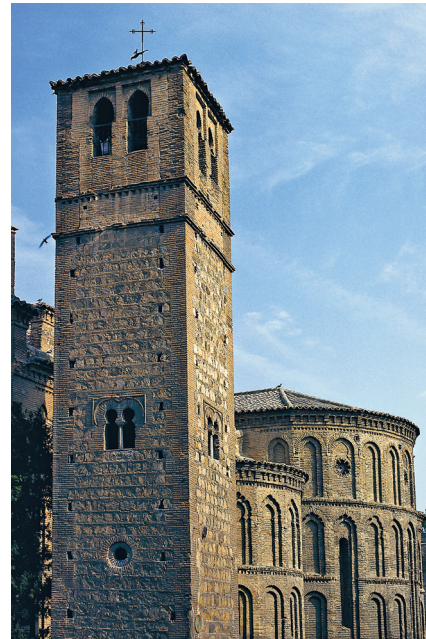
Vista del exterior de la iglesia de Santiago del Arrabal (Toledo)