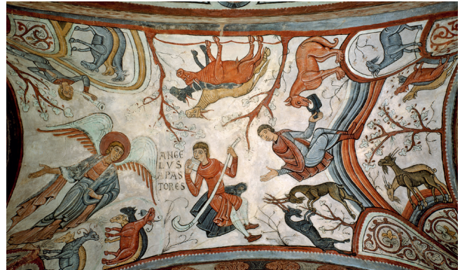
Anuncio a los pastores del Panteón Real de San Isidoro. (León)

5 Analiza y comenta esta pintura respondiendo a las siguientes cuestiones (1,5 puntos).