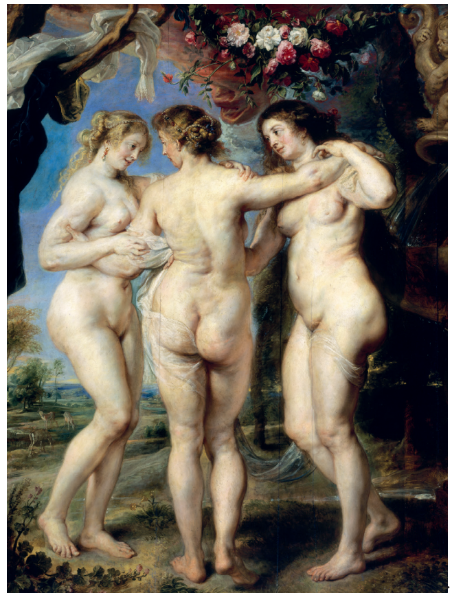
Las tres gracias. Rubens (Museo del Prado)

Read, H.: Arte y sociedad , Barcelona, Edicions 62, 1969, p. 106