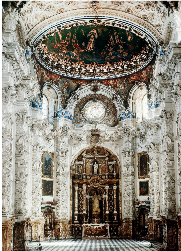
Vista interior de la sacristía de la Cartuja de Granada. Francisco Hurtado Izquierdo

4 Analiza y comenta esta obra arquitectónica respondiendo a las siguientes cuestiones. (1,5 puntos)