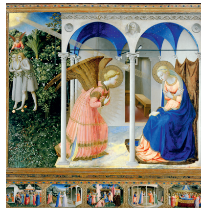
La Anunciación. Fra Angelico (Museo del Prado, Madrid)

Piero della Francesca: Sulla prospettiva della pintura , libro I.