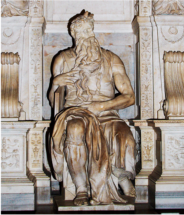
Moisés. Miguel Ángel (Iglesia de San Pietro in Vincoli, Roma)