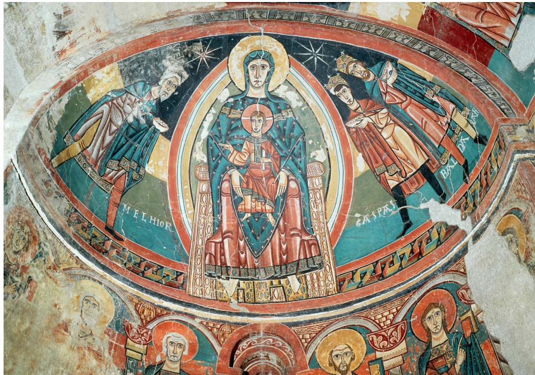
Maiestas Mariae de Santa María de Tahüll (Museo Nacional de Arte de Cataluña, Barcelona)

Liber Sancti Jacobi. Codex Calixtinus , traducción de Moralejo, S., Torres, C., y Feo, J..