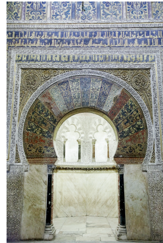
Fachada del mihrab de la mezquita de Córdoba (Córdoba).

6 Analiza y comenta este plano arquitectónico atendiendo al siguiente esquema. (1,5 puntos)