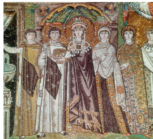
La emperatriz Teodora y su séquito (San Vital, Rávena)

8 Realiza una redacción sobre el tema “La decoración musivaria en el arte bizantino” (marco geográfico y cronológico, contexto histórico, técnica, características formales e iconografía), integrando en ella la información que te proporciona esta imagen. (1,5 puntos)