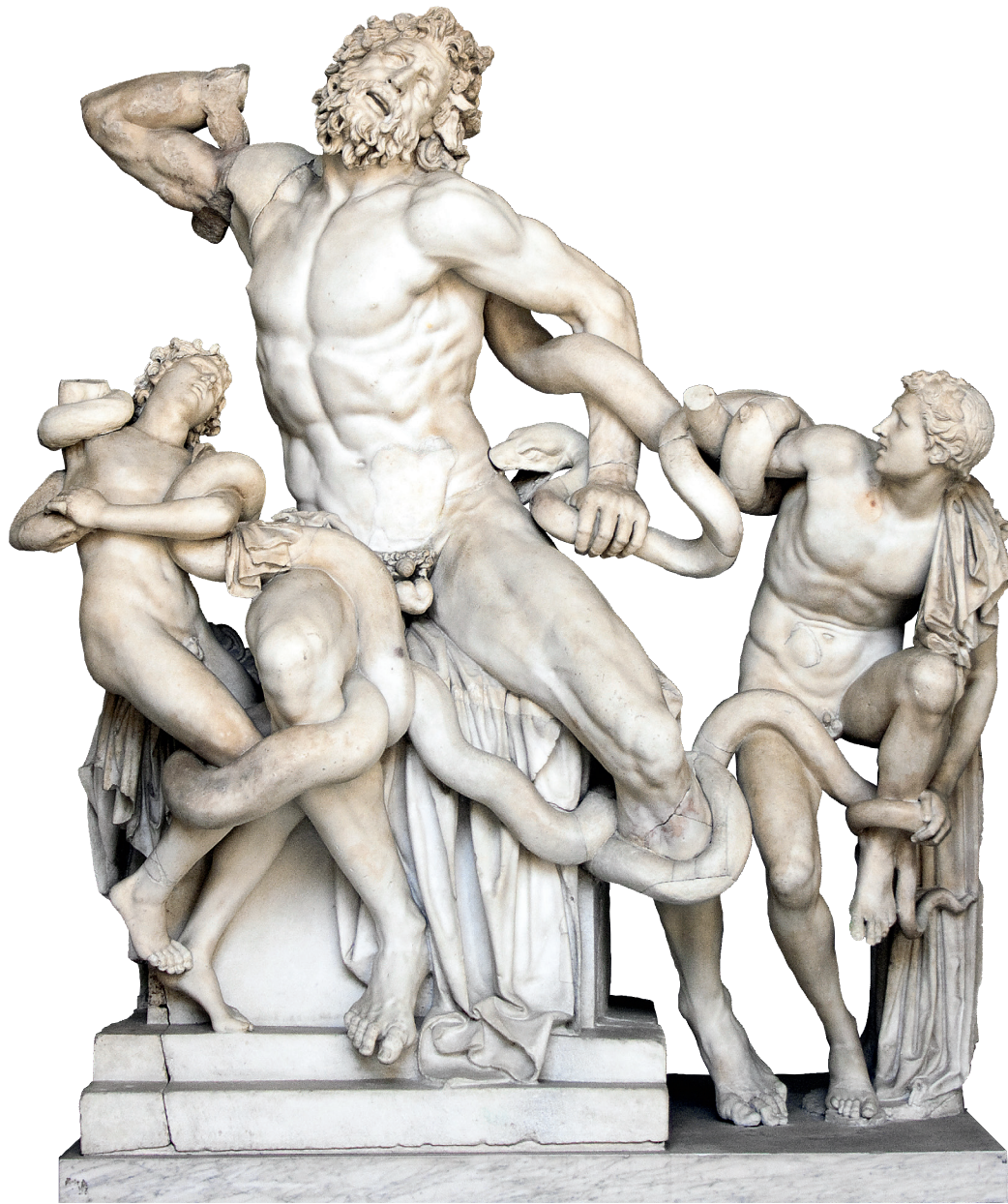
Grupo de Laoconte (Museos Vaticanos, El Vaticano)

7 Analiza esta obra escultórica siguiendo el esquema propuesto. (2 puntos)