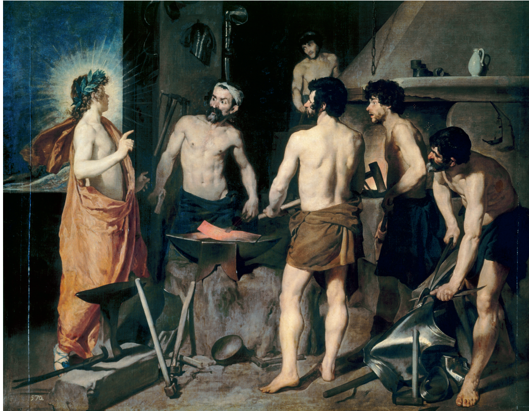
La fragua de Vulcano. Velázquez (Museo del Prado, Madrid)

4 Analiza y comenta esta obra pictórica respondiendo a las siguientes cuestiones. (1,5 puntos)