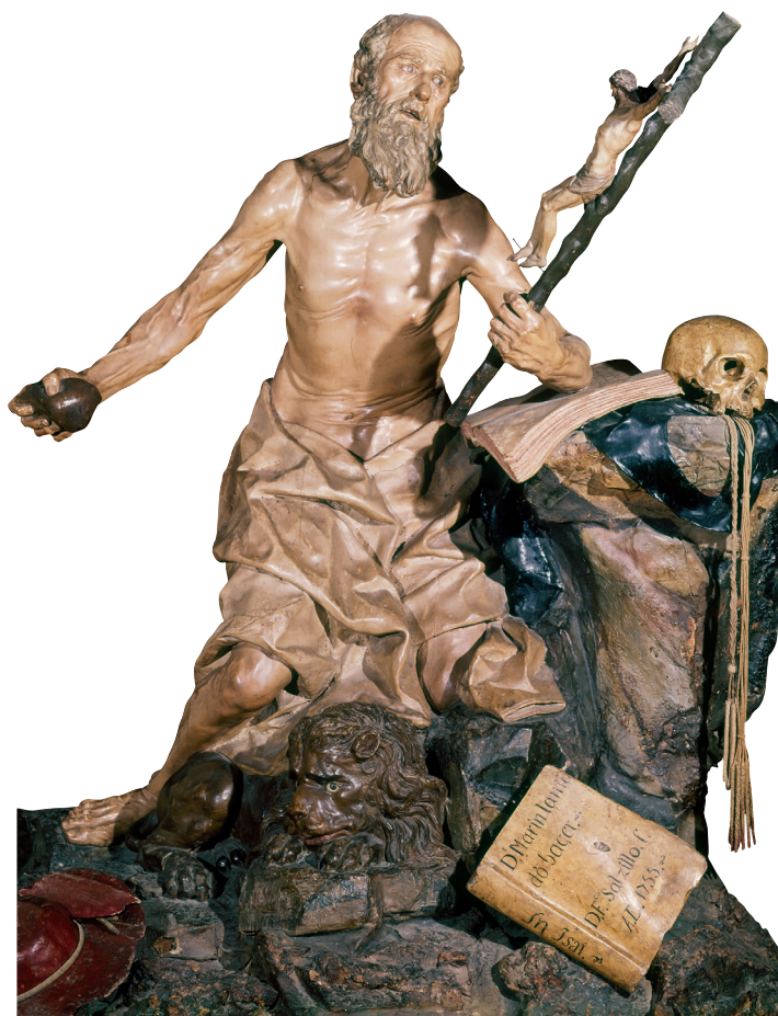
San Jerónimo Penitente. Salzillo (Museo Salzillo, Murcia)