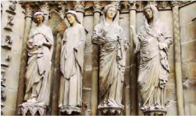
[193] Grupos de la Anunciación y Visitación (1230-1260). Piedra policromada. Jamba derecha de la portada central de la fachada occidental. Catedral de Reims.

La portada central de la fachada occidental de la catedral de Reims está dedicada a la Virgen María, que aparece protagonizando distintas escenas escultóricas con función catequética. En la jamba derecha se representan de manera consecutiva la Anunciación y la Visitación, según relata el primer capítulo del Evangelio de San Lucas: el ángel Gabriel anuncia a María el nacimiento de Jesús y, después, María visita a su prima Isabel, embarazada de San Juan Bautista. A pesar de la unidad narrativa, las cuatro figuras muestran características estilísticas diferentes que demuestran la autoría de tres escultores. Cabe destacar la expresiva figura del ángel de la Anunciación, obra del llamado Maestro de la sonrisa, y las dos que forman el grupo de la Visitación, del Maestro de las figuras antiguas, inspiradas formal y técnicamente en la estatuaria romana. Las imágenes se liberan del marco arquitectónico, gesticulan y rien, todo ello en sintonía con los tiempos naturalistas del gótico.