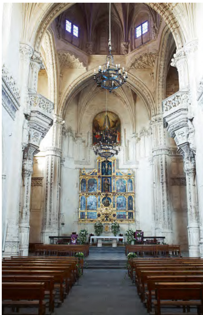
Juan Guas. Interior de la iglesia del monasterio de San Juan de los Reyes (1476-1496). Toledo.

Mientras que en Italia el nuevo estilo renacentista se desarrolló desde comienzos del siglo XV, en España hubo una pervivencia del gótico hasta bien entrado el siglo XVI. Este gótico tardío español conoció una etapa especialmente brillante durante el reinado de los Reyes Católicos, bajo cuyo patronato se levantaron numerosas fundaciones religiosas. Una de ellas fue el monasterio franciscano de San Juan de los Reyes en Toledo, construido como panteón real en conmemoración de la victoria en la batalla de Toro (1476), que confirmó en el trono de Castilla a la reina Isabel. La iglesia, trazada por el arquitecto francés Juan Guas, responde al tipo habitual de la época con nave única y capillas laterales entre los contrafuertes. Son también características del llamado «gótico isabelino» las bóvedas de crucería complejas y la profusa decoración en piedra con esculturas, tracerías y escudos heráldicos.