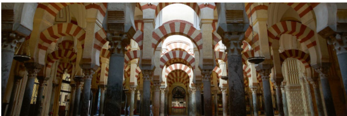
Palmeral de columnas y arquerías dobladas, pertenecientes a la ampliación de Almanzor (987 -990). Mezquita, Córdoba.

La última ampliación de la mezquita de Córdoba consistió en la adición de ocho naves y treinta y cuatro crujías en el costado oriental de la sala de oración, lo que provocó que el mihrab y la primitiva nave axial quedaran descentrados. Según el historiador Ibn Idari, «lo que [se] buscó en esta obra fue sobre todo la solidez y el acabado, pero no la ornamentación, aunque la parte que le es debida no sea inferior en calidad a ninguna de las ampliaciones sucesivas que fueron hechas en este edificio; sólo cabe hacer excepción de la obra de al-Hakam II». Hacía alusión al hecho de que en esta ampliación se evitó la profusión decorativa y se volvió a la sencillez estructural de la mezquita fundacional de Abd al-Rahman I. Se utilizaron 342 columnas, 266 de ellas en la sala de oración, con capiteles inspirados en los modelos corintios y compuestos romanos.