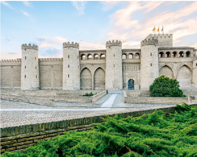
[117] Palacio de recreo de la Aljafería (1065-1081). Actual sede las Cortes de Aragón, Zaragoza.

La fragmentación e inestabilidad política del período taifa (1031-1086) dio lugar a la construcción o ampliación de muchas fortalezas. El palacio de la Aljafería se erigió por mandato del rey Abu Jafar Ahmad ibn Sulayman al-Muqtadir, de quien recibe su nombre actual, como símbolo del poder alcanzado por el reino de Zaragoza. A pesar de su aspecto fortificado, se trataba de un palacio de recreo que los miembros de la dinastía Banu Hud disfrutaban en verano, tal y como señalaba su nombre originario: Dar al-Surur (Casa del Regocijo). Posee planta cuadrada, con torres circulares en sus lienzos (la torre rectangular en el lado norte es anterior a la construcción del palacio) y un patio central con alberca. En su interior destacan los complejos sistemas de arcos entrecruzados. Es el único testimonio que se conserva en al-Ándalus de un gran edificio de la época de los taifas.