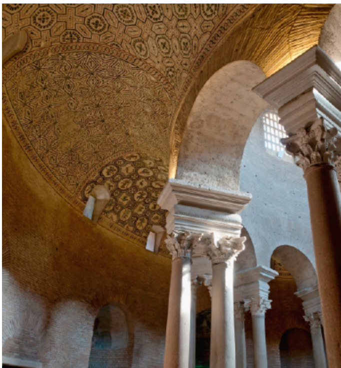
Mausoleo de Santa Constanza. Segundo cuarto del siglo IV. Roma.

El término mausoleo, con el que se denominan las tumbas de carácter monumental, procede del gran enterramiento que Mausolo (337-353 a.C.), rey de Caria, mandó construir para sí mismo en la ciudad de Halicarnaso y que fue considerada una de las siete maravillas de mundo antiguo. Como el martyrium , el mausoleo presenta planta centralizada (circular o poligonal) y su interior puede ser un ámbito único o estar dividido por un anillo de columnas que crean un espacio central cubierto con cúpula y un pasillo anular abovedado. El mausoleo de Santa Constanza se construyó junto a la basílica de Santa Inés Extramuros para enterrar a los dos hijos de Constantino, Constanza y Elena, y otras mujeres de la familia imperial. Destaca la decoración musivaria de la bóveda del deambulatorio con elementos vegetales y geométricos, retratos y escenas agrícolas.