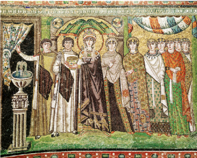
Juliano Argentario. La emperatriz Teodora, esposa de Justiniano, ofreciendo un cáliz de oro a San Vital acompañada por los miembros de su séquito (546). Mosaico en el muro sur del ábside. Iglesia de San Vital. Rávena, Italia.

El presbiterio de la iglesia de San Vital está decorado con un programa iconográfico alusivo a la eucaristía del que forman parte las dos escenas de la donación imperial. En una de ellas, Justiniano ofrece a la iglesia una patena de oro para depositar el pan y, en la otra, Teodora entrega un cáliz incrustado de perlas y piedras preciosas para contener el vino. La emperatriz aparece con la cabeza nimbada en alusión al poder recibido de Dios (los emperadores son sus vicarios en la Tierra), luce lujosas joyas y viste un manto púrpura que en su parte inferior tiene bordada la escena de la Epifanía. De esta manera se equipara su ofrenda con la que los Reyes Magos hicieron al Niño Jesús. Todos los personajes se representan hieráticos y de manera frontal, siendo la figura de Teodora la única que rompe la isocefalia para destacar su jerarquía.